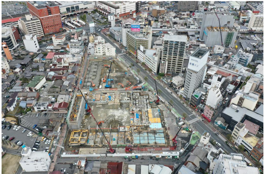
上空から撮影した写真①（3月14日撮影）

今後も、工事の進捗状況等については、再開発ニュースや当組合ホームページを通じて、皆様に発信していきますのでご注視ください。