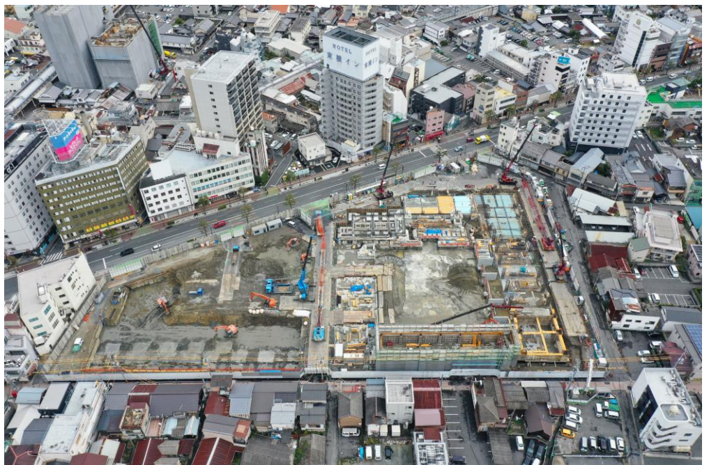
上空から撮影した写真②（3月14日撮影）